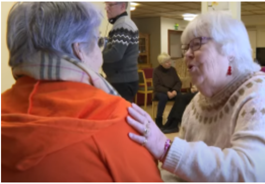
Keho- ja mieli vuorovaikutuksessa - video

youtube.com/@eklry > soittolistat > Keho & Mieli youtube.com/@eklry > soittolistat > Mielen hyvinvointia eläkkeensaajalle