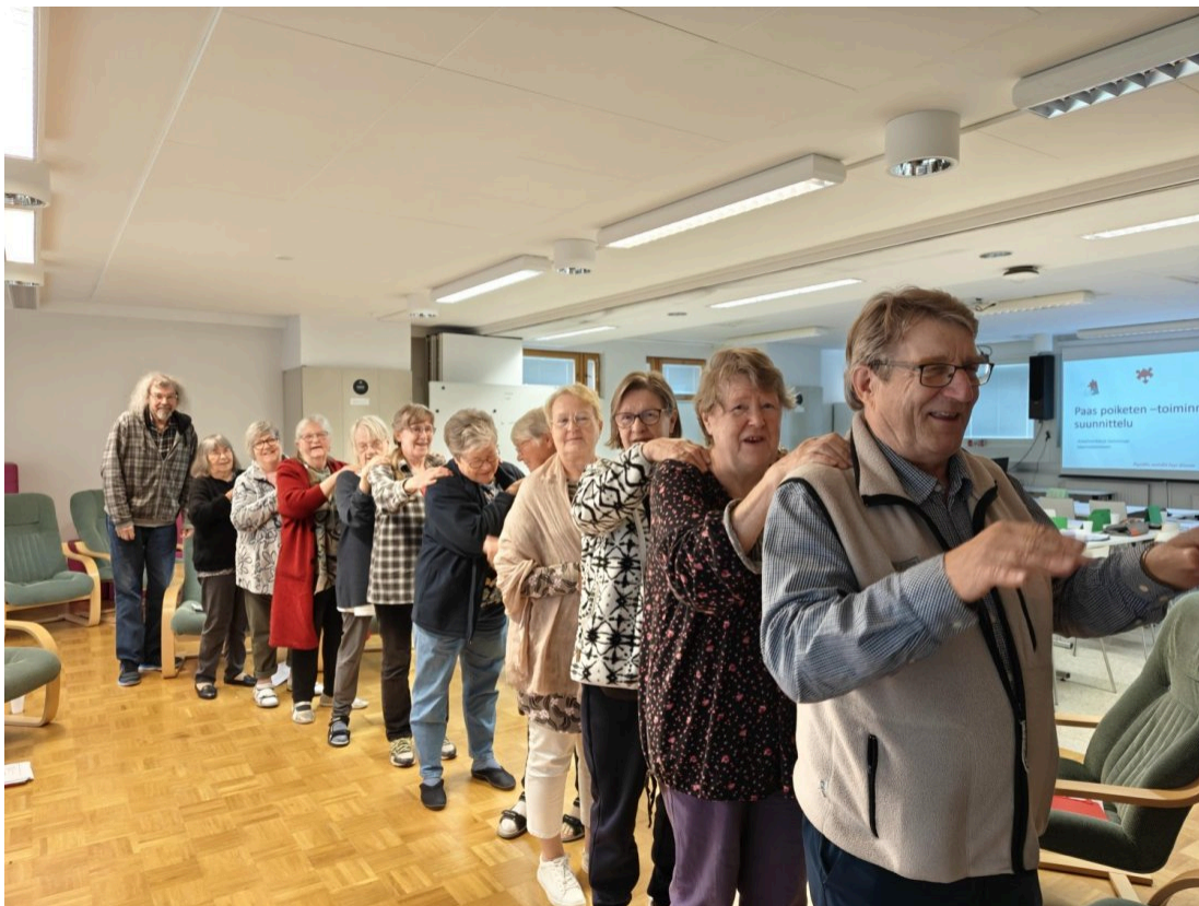
Välillä hierottiin jumit pois