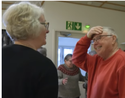
Keho ja Mieli -koulutuksessa 2023

5.11. Nestorit-juhla Jämsänkoskella Ilmoittaudu viim. 21.10 TÄSTÄ tai jarkko.utriainen@ekl.fi , puh. 050 436 3449.