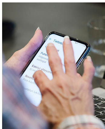
↑ Opastuksessa otetaan laitteet hallintaan.

– Loput ovat ikään kuin taustalla. Osa pitää taukoa, osa saa ja seuraa aineistojamme ja auttaa ikätovereitaan lähipiirissä. Opastajat ovat todella sitoutu-