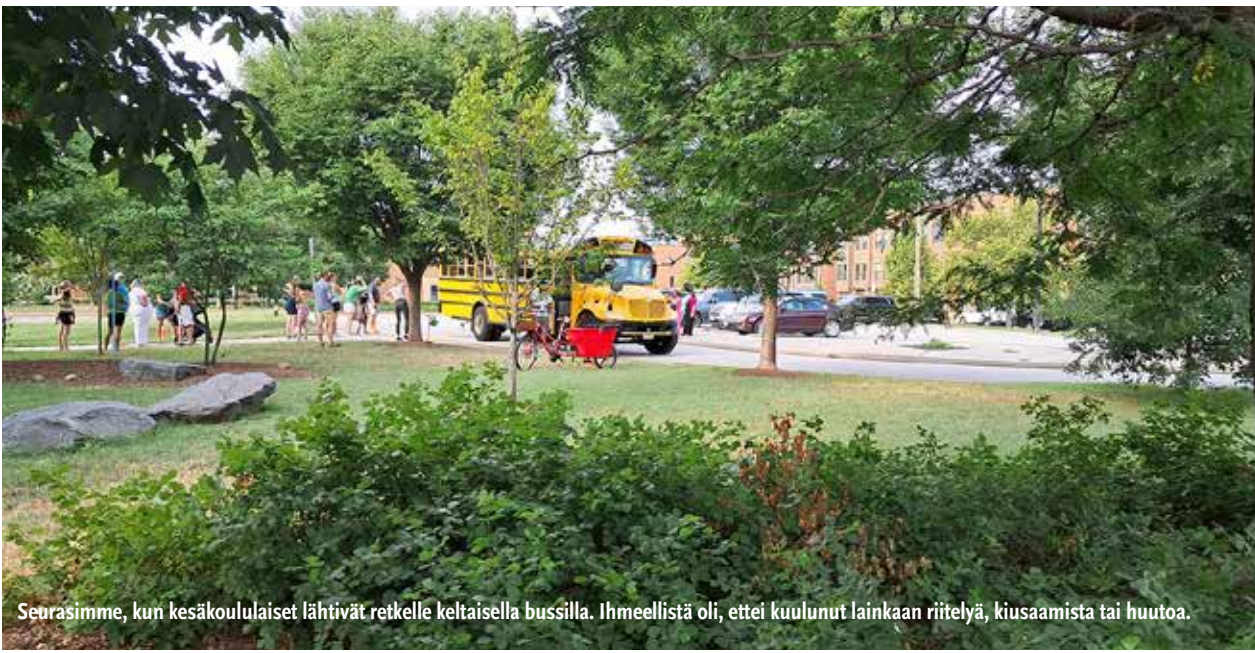
Seurasimme, kun kesäkoululaiset lähtivät retkelle keltaisella bussilla. Ihmeellistä oli, ettei kuulunut lainkaan riitelyä, kiusaamista tai huutoa.

Ensimmäisinä päivinä oli aika moiset helteet, minkä jälkeen 30 astetta tuntui kohtuulliselta. Miljan