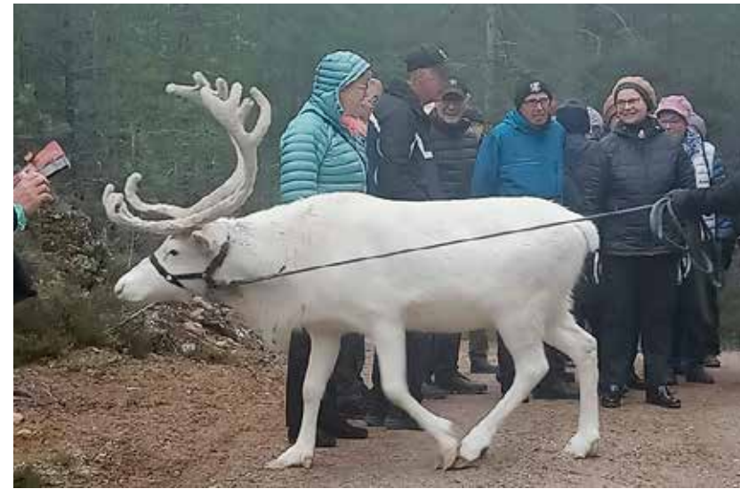
Iso-Syötteen matka vei meidät tunturin huipulle vuoden 2018 tulipalon jälkeen uudelleen rakennettuun hotelliin, jolle annan 5 tähteä. Laadukas hotelli, kylpylä, jylhät maisemat, tosi hyvä ruoka – ja ohjelmassa myös tutustumista poroihin ja huskyihin.

Sokkomatka on ylivoimaisesti suosituin. Sen matkakohteet tiedämme etukäteen vain me ja