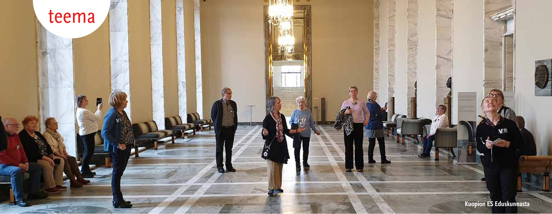
Kuopion ES Eduskunnasta