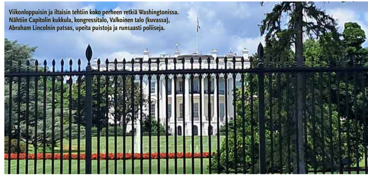
Viikonloppuisin ja iltaisin tehtiin koko perheen retkiä Washingtonissa. Nähtiin Capitolin kukkula, kongressitalo, Valkoinen talo (kuvassa), Abraham Lincolnin patsas, upeita puistoja ja runsaasti poliiseja.